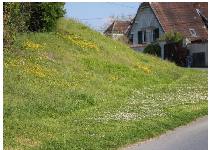
Talus entre les Groues et la Croix Bossée

Et puis moins de tonte, c'est moins de bruit, et une économie de temps de travail qui peut être affectée à d'autres tâches.